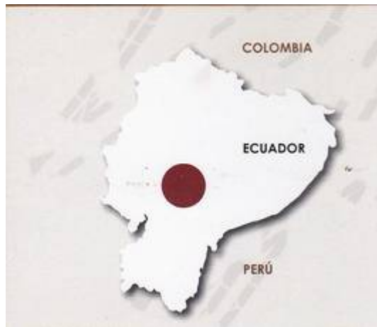
Imagen 1: Mapa Ecuador

Salinas es un pequeño pueblo de la serranía ecuatoriana, se ubica en la parte norte de la Provincia de Bolívar, Cantón Guaranda. Su temperatura promedio es de 12°C. Dispone de uno de los principales sitios de producción de sal. Está ubicada en las estribaciones occidentales de los Andes Ecuatorianos (600-4000m)