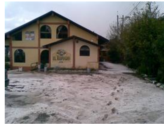
Imagen 4: Hotel el refugio

Unidades Productivas y de Servicio: Secadora de Hongos, Molino y fábrica de fideos, Hacienda y bosque de pino, Oficina de Turismo, Hotel y auditorio