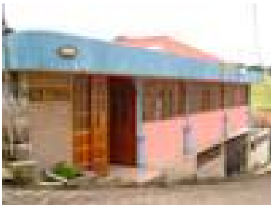
Imagen 3: Sede Funorsal

FFSS: Descripción: Se fundó en 1995 con el fin de apoyar; como grupo de seglares comprometidos, a la Misión Salesiana, La FFSS se legalizó en el año 2002. Siguiendo la regla salinera del camino a la autogestión, la Fundación ha creado varias fuentes de trabajo para sostener sus actividades sociales.